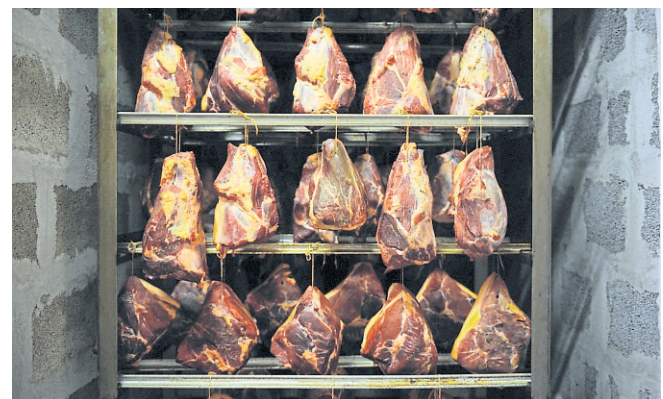
Eine Woche lang wird der Schinken kalt geräuchert.