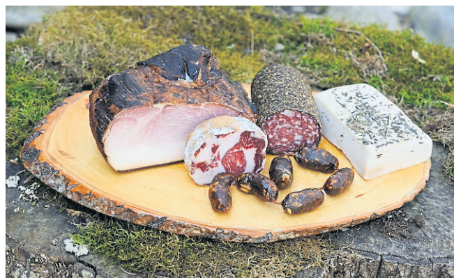
Verarbeitet wird das Fleisch etwa zu Osterschinken (l.).

Biofest: 30. Mai Besichtigung der Schweine, Kinderprogramm, Bauerngolf, Musik u. v. m.